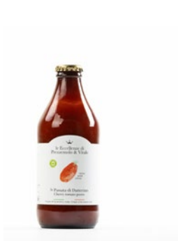
PASSATA DI DATTERINO Datterini tomatoes purée Senza acido citrico Citric acid-free Cod: 0029372 - 330 g