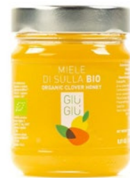
MIELE SULLA BIO Organic sulla honey Cod: 0020689 - 250 g