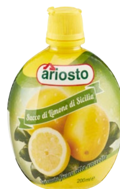
ARIOSTO Succo di limone siciliano Sicilian lemon juice Cod: 0022907 - 200 ml