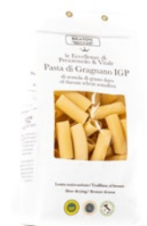
RIGATONI Lenta essiccazione trafilata al bronzo Slow drying / bronze drawn Cod: 0031721 - 500 g