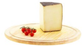
NERO SICANO PICCANTINO DEL BELICE Black sicano Belice spicy cheese Cod: 0053347