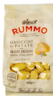
RUMMO Gnocchi di patate Potato gnocchi Cod: 0025331 - 500 g