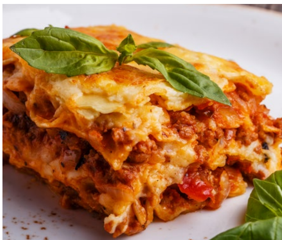
LASAGNA EMILIANA Traditional lasagna Cod: 0053204