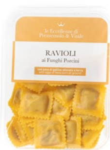
RAVIOLI AI FUNGHI PORCINI Porcini mushrooms ravioli Cod: 0025006 - 250 g