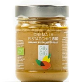
CREMA DI PISTACCHIO BIO Organic pistachio spread Cod: 0020439 - 200 g