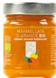
MARMELLATA DI ARANCE BIONDE BIO Organic blonde orange marmelade Cod: 0020387 - 250 g