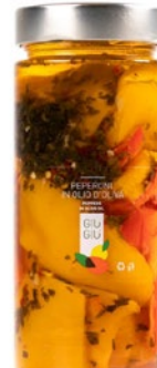
PEPERONI IN OLIO D'OLIO D'OLIVA Peppers in olive oil Cod: 0030350 - 314 ml