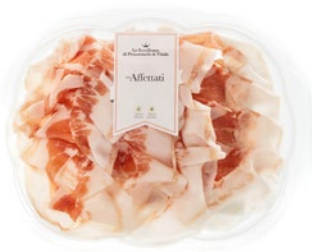
PANCETTA Pancetta senza glutine, senza lattosio gluten free, lactose free Cod: 0020877 - 80 g