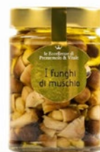
FUNGHI DI MUSCHIO Honey mushrooms Cod: 0031478 - 280 g