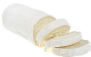
CHÈVRE Cod: 0053208