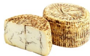
PECORINO MOLITERNO AL TARTUFO Moliterno pecorino cheese with truffles Cod: 0077091