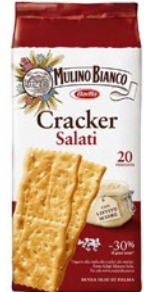
MULINO BIANCO Crackers Saltines Integrali / Whole grain Non salati / Unsalted Salati / Salted Cod: 0018958 - 500 g Cod: 0018953 - 500 g Cod: 0018980 - 500 g