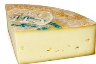
FONTINA VALDOSTANA Fontina from Valle d'Aosta Forma/Wheel Cod: 0053365 1/4 Cod: 0018208