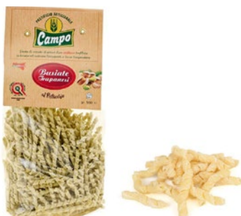
CAMPO Busiate trapanesi al pistacchio Pistachio busiate pasta Cod: 0021067 - 500 g