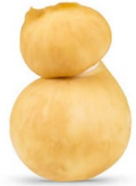
SCAMORZA AFFUMICATA Smoked scamorza cheese Cod: 0035042 - 350 g