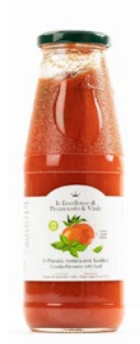
PASSATA RUSTICA CON BASILICO Crushed tomato with basil Senza acido citrico Citric acid-free Cod: 0029374 - 680 g