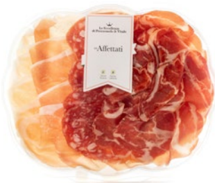
ANTIPASTO MIX DI SALUMI E AFFETTATI Italian starters senza glutine, senza lattosio gluten free, lactose free Cod: 0020485 - 120 g