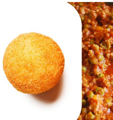
ARANCINA ALLA CARNE Meat arancina Cod: 0053882