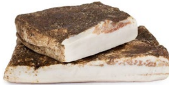
LARDO DI COLONNATA IGP PGI Colonnata lard Cod: 0054631