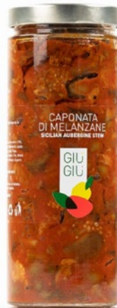
CAPONATA DI MELANZANE Sicilian aubergine stew Cod: 0078536 - 300 g Cod: 0020610 - 950 g