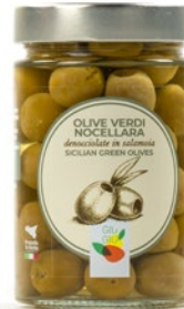
OLIVE NOCELLARA DENOCCIOLATE Sicilian Nocellara olives in brine - pitted Cod: 0025201 - 300 g