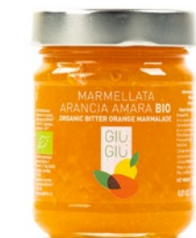
MARMELLATA ARANCIA AMARA BIO Organic bitter orange marmelade Cod: 0020382 - 250 g