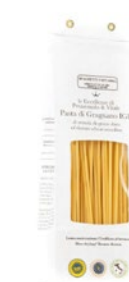
SPAGHETTI ALLA CHITARRA Lenta essiccazione trafilata al bronzo Slow drying / bronze drawn Cod: 0031736 - 500 g