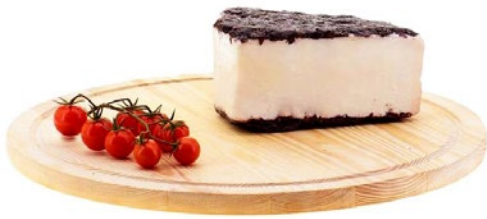
UBRIACO AL BAROLO Barolo drunken cheese Cod: 0053308