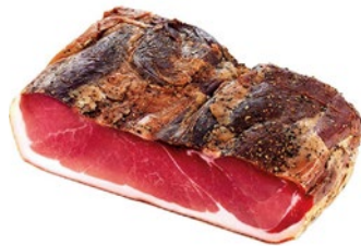
SPECK IGP - tranci PGI Speck - steak Cod: 0074519 - 350 g c.ca