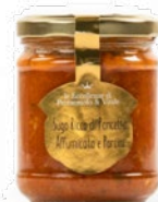
SUGO RICCO DI PANCETTA AFFUMICATA E PORCINI Smoked bacon and Porcini mushrooms sauce Cod: 0033528 - 80 g