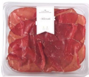
CARPACCIO DI BRESAOLA Bresaola carpaccio senza glutine, senza lattosio gluten free, lactose free Cod: 0034516 - 100 g