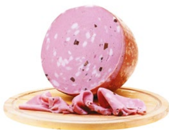
MORTADELLA AL TARTUFO Mortadella with truffle Cod: 0054746