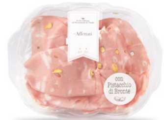
MORTADELLA AL PISTACCHIO Mortadella with pistachio senza glutine, senza lattosio gluten free, lactose free Cod: 0031449 - 100 g