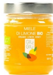
MIELE LIMONE BIO Organic lemon honey Cod: 0024292 - 250 g