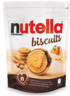
FERRERO Nutella biscuits Cod: 0023885 - 304 g