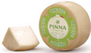
BRIGANTE DI CAPRA SARDA Sardinian goat cheese brigante Cod: 0026816