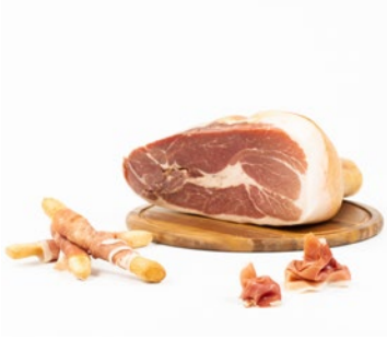
PROSCIUTTO CRUDO DI PARMA Parma raw ham Cod: 0053390