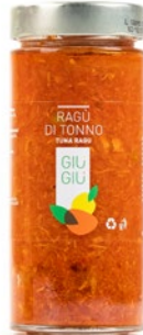
RAGÙ DI TONNO Tuna ragu Cod: 0029532 - 300 g