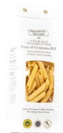
PENNE RIGATE Lenta essiccazione trafilata al bronzo Slow drying / bronze drawn Cod: 0031734 - 500 g