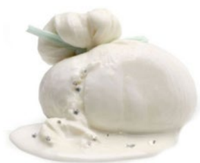
BURRATA AL TARTUFO Truffles burrata Cod: 0026758 - 125 g