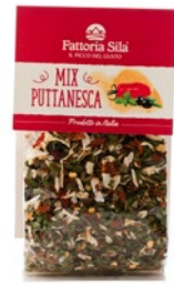
FATTORIA SILA Mix puttanesca Pasta Dried spice mix Cod: 0029303 - 50 g