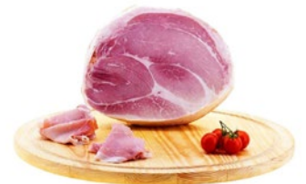
PROSCIUTTO COTTO S. GIOVANNI S. Giovanni cooked ham Cod: 0060039