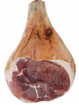
PROSCIUTTO CRUDO SAN DANIELE (DISOSSATO) San Daniele raw ham (boneless) Cod: 0056668