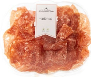
SALAME MILANO "Milano" salami senza glutine, senza lattosio gluten free, lactose free Cod: 0020878 - 80 g