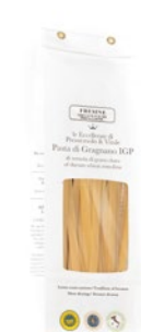
FRESINE Lenta essiccazione trafilata al bronzo Slow drying / bronze drawn Cod: 0035034 - 500 g