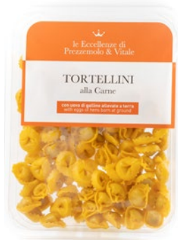
TORTELLINI ALLA CARNE Meat tortellini Cod: 0025005 - 250 g