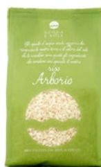
ACQUA E SOLE Riso arborio Arborio rice Cod: 0021082 - 500 g