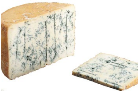
GORGONZOLA PICCANTE Piquant gorgonzola cheese 1/8 Cod: 0048620