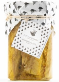
FILETTI DI SGOMBRO IN OLIO DI OLIVA Mackerel fillets in olive oil Cod: 0075994 - 300 g