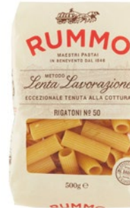
RUMMO Rigatoni n° 50 Cod: 0071484 - 500 g