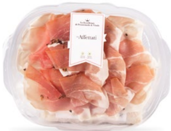
PROSCIUTTO CRUDO AL TARTUFO Raw ham with truffles senza glutine, senza lattosio gluten free, lactose free Cod: 0032248 - 100 g