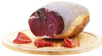
CULATTA Cod: 0032351