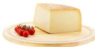
PECORINO STAGIONATO CANESTRATO Aged canestrato pecorino cheese Cod: 0053348