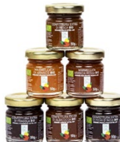
CONFETTURA EXTRA DI FRUTTA BIO - VARI GUSTI PESCA, ARANCE, ARANCIA ROSSA, FRAGOLA, ALBICOCCA, FICHI D'INDIA Organic extra jam - mixed flavours peach, oranges, red orange, strawberry, apricot, prickly pear Cod: 0024281 - 50 g