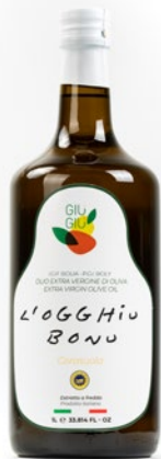
OLIO EXTRA VERGINE D'OLIVA CERASUOLA IGP SICILIA P.G.I. Sicily Cerasuolo extra virgin olive oil Cod: 0029932 - 1 L