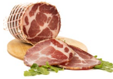
CAPOCOLLO DI MARTINA FRANCA Cured ham of Martina Franca Cod: 0030816