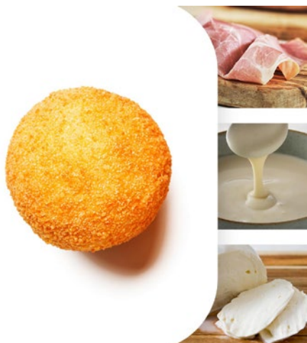
ARANCINA AL BURRO Mozzarella and ham arancina Cod: 0068558