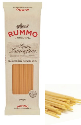
RUMMO Spaghetti alla chitarra n° 104 Cod: 0019763 - 500 g