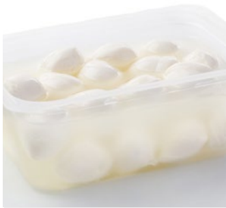
CILIEGINA VASCHETTA Cherry mozzarella Cod: 0026760 - 250 g