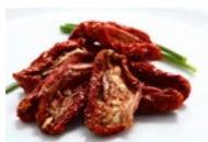
CAMPISI Ciliegino secco Dried cherry tomatoes Cod: 0055603 - 250 g