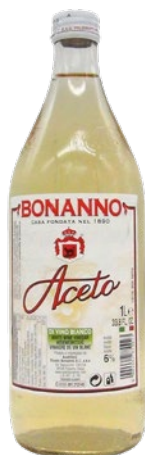
BONANNO Aceto di vino bianco White wine vinegar Cod: 0017041 - 1 L