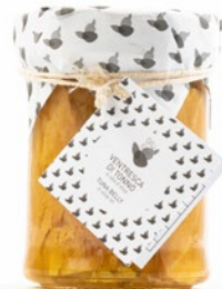
VENTRESCA DI TONNO IN OLIO D'OLIVA Tuna belly in olive oil Cod: 0075056 - 200 g