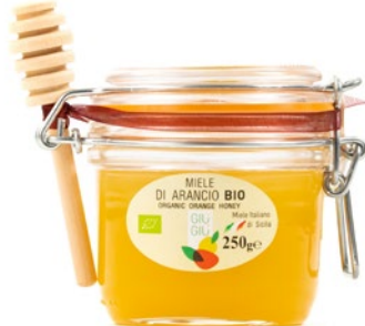
MIELE DI ARANCIO BIO CON SPARGIMIELE Organic orange honey with dripper Cod: 0028609 - 250 g