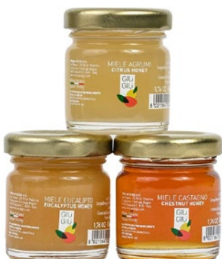
MIELE MONODOSE - VARI GUSTI Agrumi, eucaliptus, castagno Single-portion honey - assorted flavours Citrus, eucaliptus, chestnut Cod: 0078838 - 50 g