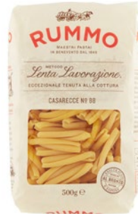
RUMMO Casarecce n° 88 Cod: 0019770 - 500 g