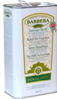
BARBERA Olio extravergine d'oliva selezione unica Unique selection extra virgin olive oil Cod: 0019072 - 3 L