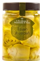
CUORI DI CARCIOFO Artichoke hearts Cod: 0031475 - 280 g