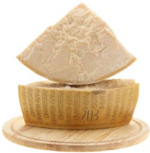
PARMIGIANO REGGIANO 24 MESI 24 month seasoned parmigiano reggiano Forma/Wheel Cod: 0025896