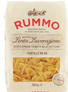
RUMMO Farfalle n° 85 Cod: 0019769 - 500 g