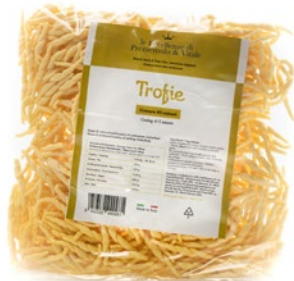
TROFIE Handmade durum wheat semolina pasta Cod: 0030330 - 500 g