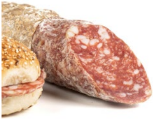
SALAME FELINO IGP PGI Felino salami Cod: 0029371