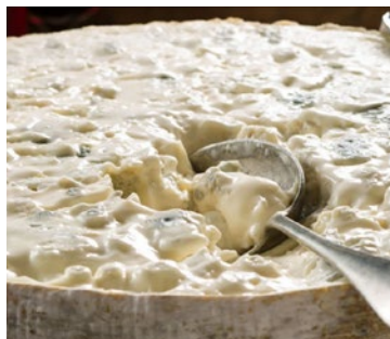
GORGONZOLA AL CUCCHIAIO Creamy gorgonzola cheese Cod: 0019942