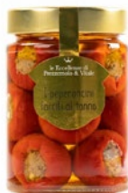
PEPERONCINI FARCITI AL TONNO Chili Peppers with Tuna Cod: 00332012 - 280 g