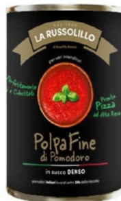
LA RUSSOLILLO Pelato polpa fine Peeled tomatoes fine pulp Cod: 0034206 - 4 kg