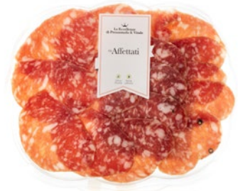
SALAME FELINO "Felino" matured salami senza glutine, senza lattosio gluten free, lactose free Cod: 0020481 - 80 g