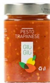
PESTO TRAPANESE Trapanese pesto Cod: 0078530 - 200 g