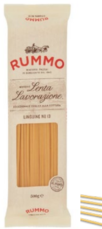
RUMMO Linguine n° 13 Cod: 0019761 - 500 g Cod: 0035052 - 3 kg