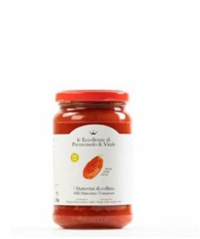
DATTERINO DI COLLINA Hill datterino tomatoes Senza acido citrico Citric acid-free Cod: 0029373 - 360 g