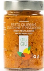
PESTO CILIEGINO, ZUCCHINE, PISTACCHIO Cherry tomato, zucchini, pistachio pesto Cod: 0078528 - 200 g