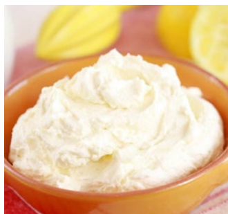
PASTA DI ROBIOLA Robiola cream cheese Cod: 0057854