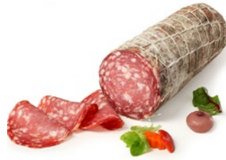
SALAME NAPOLI "Napoli" salami Cod: 0025746