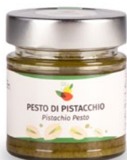
PESTO DI PISTACCHIO Pistachio pesto Cod: 0033981 - 190 g