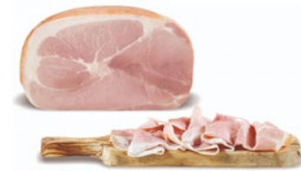
PROSCIUTTO COTTO DI VIGNOLA Vignola Cooked ham Cod: 0053416