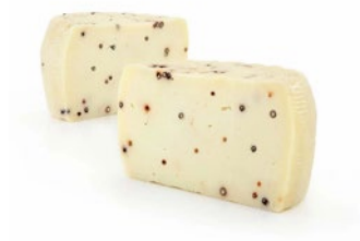
PRIMOSALE AL PEPE O PEPERONCINO slightly-aged Pecorino pepper or chilli pepper Cod: 0053361