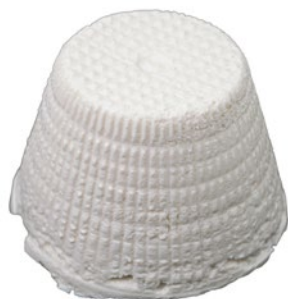
RICOTTA Ricotta cheese Cod: 0034330 - 1,5 kg