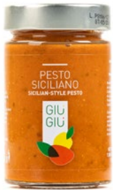
PESTO SICILIANO Sicilian pesto Cod: 0065711 - 200 g