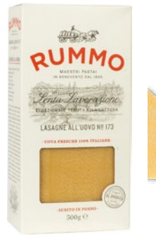
RUMMO Lasagne n° 173 Cod: 0077347 - 500 g