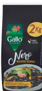
GALLO Riso nero Black rice Cod: 0027731 - 2 kg