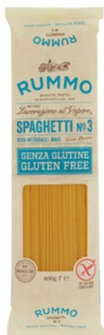
RUMMO Spaghetti n°3 Cod: 0073397 - 400 g