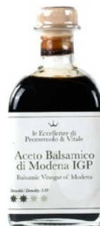
DI ACETO BALSAMICO DI MODENA I.G.P. - Densità 19 P.G.I. balsamic vinegar of Modena - 19 density Cod: 0030486 - 250 ml