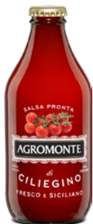
AGROMONTE Salsa di ciliegino Cherry tomato sauce Cod: 0020383 - 33 cl