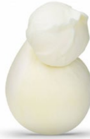
SCAMORZA BIANCA White scamorza cheese Cod: 0035043 - 350 g