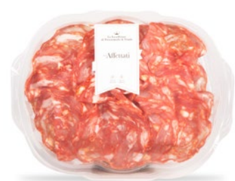
VENTRICINA Ventricina spicy salami senza glutine, senza lattosio gluten free, lactose free Cod: 0032247 - 80 g