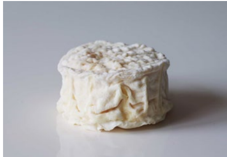
ALTA LANGA LA TUR Cod: 0066714 - 230 g