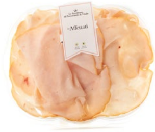
FESA DI TACCHINO Turkey breast senza glutine, senza lattosio gluten free, lactose free Cod: 0020884 - 100 g