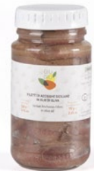
FILETTI DI ACCIUGHE IN OLIO DI OLIVA Anchovy fillets in olive oil Cod: 0031974 - 140 g