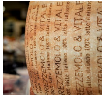
GRAN P&V - 18 mesi 18 month seasoned cheese Forma/Wheel Cod: 0062783 1/8 Cod: 0021066