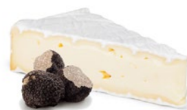
BRIE AL TARTUFO Truffle brie Cod: 0036739 Cod: 0032631 - 3 kg