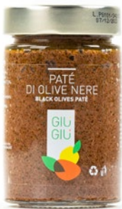
PATÉ DI OLIVE NERE Black olives paté Cod: 0075058 - 200 g