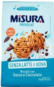
MISURA PRIVOLAT Biscotti con gocce di cioccolato Chocolate chips biscuits Cod: 0013014 - 290 g