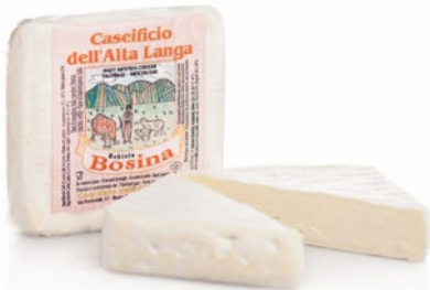
ALTA LANGA BOSINA Cod: 0066718 - 300 g