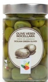
OLIVE VERDI NOCELLARA Sicilian Nocellara olives Cod: 0025202 - 300 g