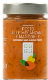
PESTO MELANZANE E MANDORLE Aubergine and almond pesto Cod: 0065712 - 200 g