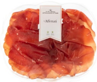
BRESAOLA Bresaola senza glutine, senza lattosio gluten free, lactose free Cod: 0020872 - 80 g