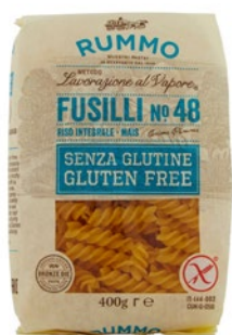
RUMMO Fusilli n°48 Cod: 0073400 - 400 g