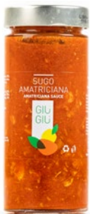
SUGO AMATRICIANA Amatriciana sauce Cod: 0066085 - 300 g