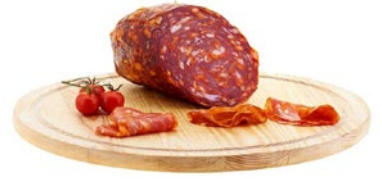
VENTRICINA PICCANTE Spicy Ventricina Cod: 0053411