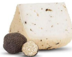
PECORINO TOSCANO AL TARTUFO Tuscan pecorino cheese with truffles Cod: 0055341