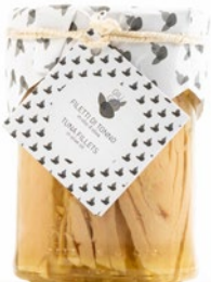
FILETTI TONNO IN OLIO D'OLIVA Tuna fillets in olive oil Cod: 0075054 - 200 g