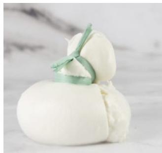
BURRATINA Burratina cheese Cod: 0034889 - 125 g