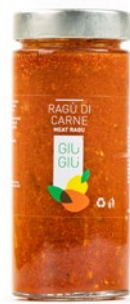
RAGÙ DI CARNE Meat ragu Cod: 0029843 - 300 g