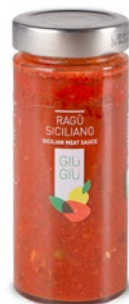
RAGÙ SICILIANO Sicilian ragu Cod: 0029619 - 300 g