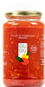
POLPA DI POMODORO BIO Organic tomato pulp Cod: 0020538 - 446 ml