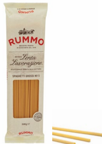
RUMMO Spaghetti grossi n° 5 Cod: 0035053 - 3 kg