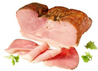
PROSCIUTTO COTTO ARROSTO Roasted cooked ham Cod: 0069566