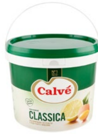
CALVÈ Mayonnaise Cod: 0077393 - 5 kg