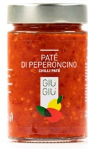
PATÉ DI PEPERONCINO Chilli paté Cod: 0078162 - 200 g