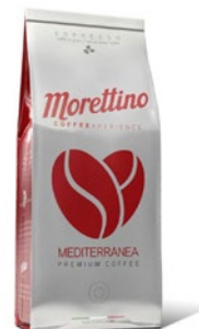
MORETTINO Caffè in grani Coffee in beans Cod: 0073083 - 1 kg