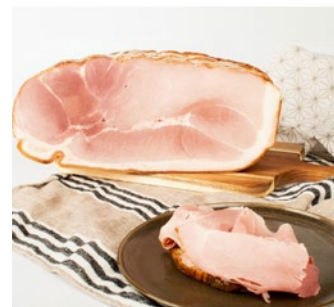
PROSCIUTTO COTTO DI PRAGA Prague ham Cod: 0032332