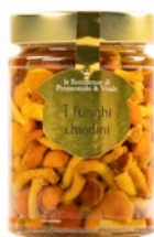
FUNGHI CHIODINI Chiodini mushrooms Cod: 0028941 - 280 g