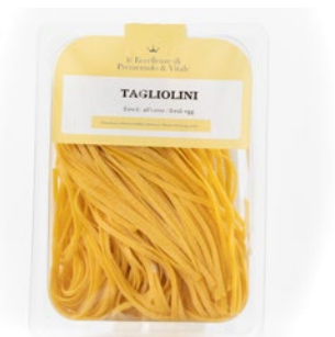
TAGLIOLINI Fresh egg Tagliolini Cod: 0030603 - 250 g