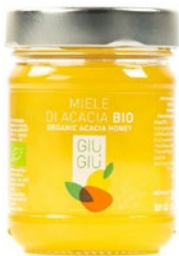
MIELE ACACIA BIO Organic acacia honey Cod: 0020681 - 250 g