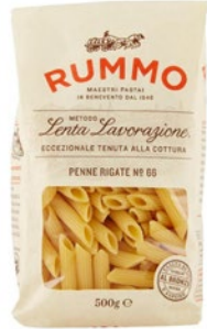
RUMMO Penne rigate n° 66 Cod: 0019768 - 500 g Cod: 0035050 - 3 kg