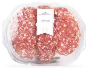
SALAME DEL BORGO Salami with fennel seeds senza glutine, senza lattosio gluten free, lactose free Cod: 0032243 - 100 g