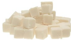
MOZZARELLA A CUBETTI Diced mozzarella Cod: 0035045 - 3 kg