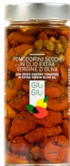
POMODORO CILIEGINO SECCO SOTT'OLIO Sun-dried cherry tomatoes in extra virgin olive oil Cod: 0075044 - 300 g