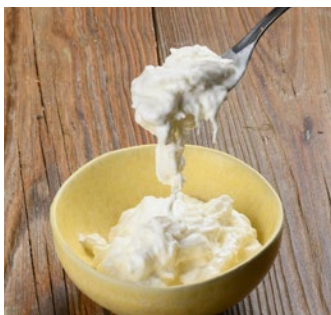
STRACCIATELLA Cod: 0026765 - 250 g