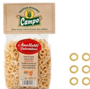
CAMPO Anelletti palermitani Anelletti pasta from Palermo Cod: 0066491 - 500 g