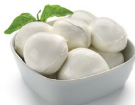
MOZZARELLA DI BUFALA DOP BOCCONCINI PDO buffalo mozzarella stewballs Cod: 0033587 - 250 g