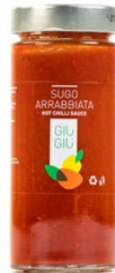
SUGO ALL'ARRABBIATA Hot chilli sauce Cod: 0065852 - 300 g