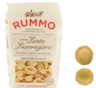
RUMMO - LE LEGGENDARIE Orecchiette n° 87 Cod: 0019772 - 500 g