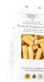
RIGATONI Lenta essiccazione trafilata al bronzo Slow drying / bronze drawn Cod: 0031721 - 500 g