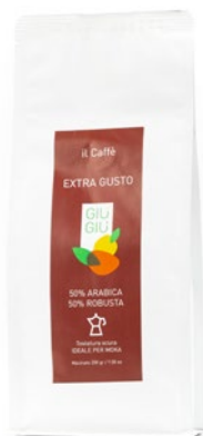
CAFFÈ EXTRA GUSTO Extra flavour coffee Cod: 0023267 - 200 g