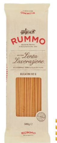
RUMMO Bucatini n° 6 Cod: 0071482 - 500 g