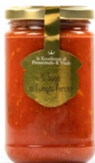
SUGO AI FUNGHI PORCINI Porcini mushrooms sauce Cod: 0031474 - 300 g