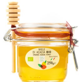
MIELE DI ACACIA BIO CON SPARGIMIELE Organic acacia honey with dripper Cod: 0028611 - 250 g