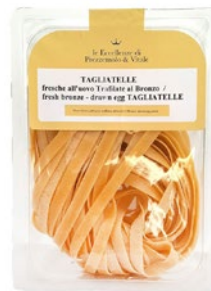
TAGLIATELLE Fresh egg Tagliatelle Cod: 0030602 - 250 g