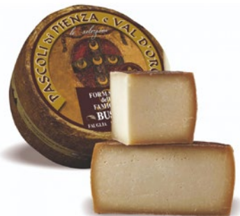
PIENZA NERO Black Pienza cheese Cod: 0032289