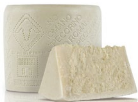
PECORINO ROMANO Roman pecorino cheese Cod: 0053362