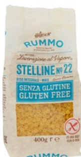
RUMMO Stelline n°22 Cod: 0073402 - 400 g