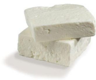
FETA Feta cheese Cod: 0054160