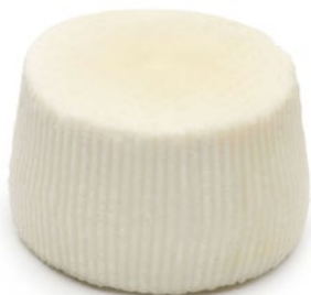
CACIORICOTTA Cod: 0025225