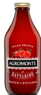
AGROMONTE Salsa di datterino Datterino tomato sauce Cod: 0020904 - 33 cl