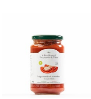
SPACCATELLE DI POMODORO Tomato fillets Senza acido citrico Citric acid-free Cod: 0029375 - 360 g