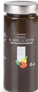
SUGO AL NERO DI SEPIA Tomato sauce with squid ink Cod: 0066151 - 300 g