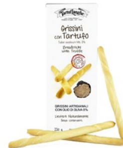
TARTUFLANGHE Grissini con tartufo Breadsticks with truffle Cod: 0019229 - 200 g