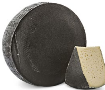
ASIAGO CROSTA NERA DOP Forma/Wheel Cod: 0055594 1/4 Cod: 0018207