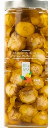
CARCIOFINI IN OLIO EXTRAVERGINE DI OLIVA Artichokes in extra virgin olive oil Cod: 0034310 - 300 g Cod: 0075245 - 1 kg