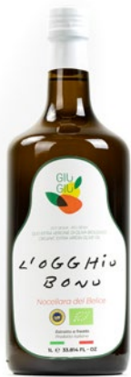
OLIO EXTRA VERGINE D'OLIVA NOCELLARA IGP SICILIA Organic P.G.I. Sicily Nocellara del Belice extra virgin olive oil Cod: 0030300 - 500 ml Cod: 0029934 - 1 L