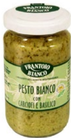
FRANTOIO BIANCO Pesto bianco con carciofi e basilico White pesto with artichoke and basil Cod: 0078556 - 180 g