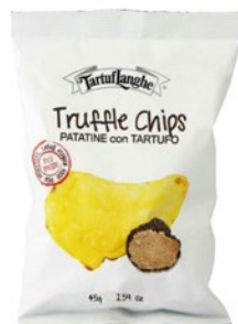
TARTUFLANGHE Patatine al tartufo Truffle chips Cod: 0076588 - 45 g Cod: 0076589 - 100 g