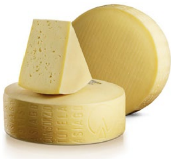
ASIAGO Cod: 0025924