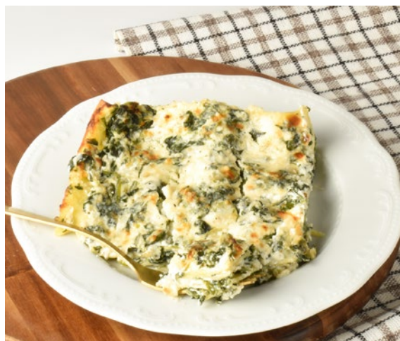
LASAGNA AGLI SPINACI Spinach lasagna Cod: 0025069