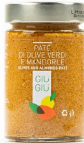
PATÉ DI OLIVE VERDI E MANDORLE Olives and almonds paté Cod: 0060153 - 200 g