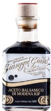
GIUSTI Aceto balsamico di Modena IGP PGI Balsamic vinegar of Modena Cod: 0017041 - 250 ML