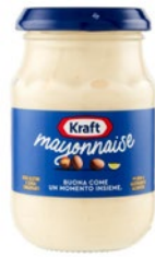
KRAFT Mayonnaise Cod: 0020169 - 465 g