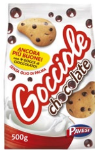
PAVESI Goccioline al cioccolato Cod: 0082988 - 500 g