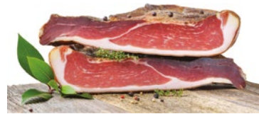
SPECK MONTE Monte speck Cod: 0053393