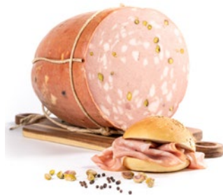
MORTADELLA AL PISTACCHIO Mortadella with pistachio Cod: 0063548