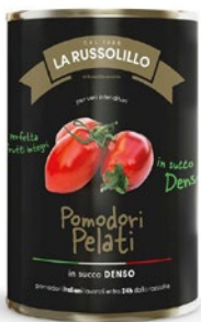
LA RUSSOLILLO Pelato Alta Qualità High quality peeled tomatoes Cod: 0034205 - 2,5 kg