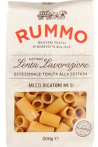
RUMMO Mezzi rigatoni n° 51 Cod: 0019766 - 500 g