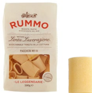
RUMMO - LE LEGGENDARIE Paccheri n° 111 Cod: 0019774 - 500 g