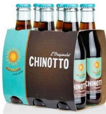
TOMARCHIO Chinotto Cod: 0016674 - 20 cl x 6