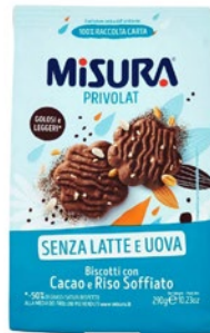
MISURA PRIVOLAT Biscotti con cacao e riso soffiato Cocoa and puffed rice biscuits Cod: 0013015 - 290 g