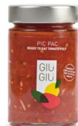
PIC PAC Ready to eat tomato pulp Cod: 0024237 - 200 g