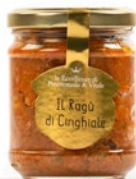
RAGÙ DI CINGHIALE Wild boar ragù Cod: 0030521 - 80 g