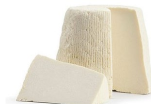
RICOTTA SALATA SICILIANA Sicilian salted ricotta Cod: 0054620