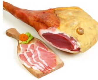
PROSCIUTTO CRUDO SAN DANIELE San Daniele raw ham Cod: 0053391