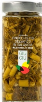
FINOCCHIETTO IN SALAMOIA Wild fennel in brine Cod: 0078537 - 280 g