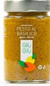
PESTO BASILICO Basil pesto Cod: 0078478 - 200 g