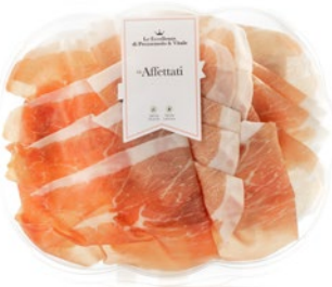
PROSCIUTTO CRUDO nazionale Raw ham senza glutine, senza lattosio gluten free, lactose free Cod: 0024605 - 100 g