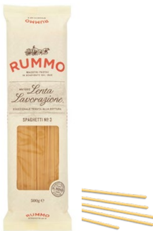
RUMMO Spaghetti n° 3 Cod: 0019760 - 500 g