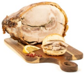
PORCHETTA DI ARICCIA Ariccia's porchetta Cod: 0029693