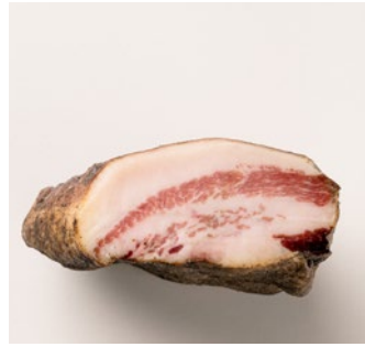
GUANCIALE ROMA Roman Cheek lard Cod: 0031698