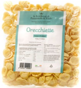
ORECCHIETTE Handmade durum wheat semolina pasta Cod: 0030333 - 500 g