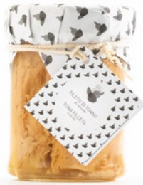
FILETTI TONNO AL NATURALE Tuna fillets in brine Cod: 0075055 - 200 g