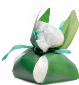
BURRATA IN FOGLIA Leaf wrapped burrata Cod: 0026938 - 250 g