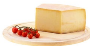
GRUVIERA Gruyere Cod: 0053367