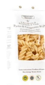
TORTIGLIONI Lenta essiccazione trafilata al bronzo Slow drying / bronze drawn Cod: 0031725 - 500 g