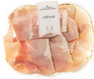
PROSCIUTTO COTTO AL ROSMARINO Cooked ham with rosemary senza glutine, senza lattosio gluten free, lactose free Cod: 0020869 - 100 g