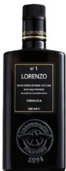
BARBERA Lorenzo n°1 - Cerasuola Olio extravergine d'oliva BIO D.O.P. P.D.O. Organic extra virgin olive oil Cod: 0055940 - 50 cl