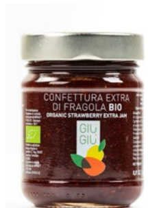
CONFETTURA EXTRA FRAGOLA BIO Organic strawberry extra jam Cod: 0020380 - 250 g