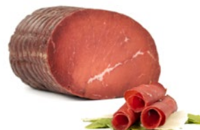
BRESAOLA Bresaola Cod: 0053408