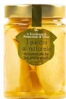
PORCINI AL NATURALE Porcini mushrooms in brine Cod: 0031481 - 220 g