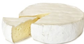
BRIE Cod: 0036739 Cod: 0032631 - 3 kg