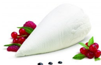
RICOTTA PIEMONTESE SEIRASS Seirass Piedmontese ricotta Cod: 0034929 - 1 kg