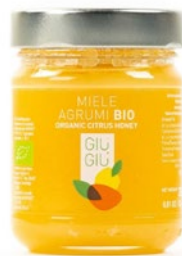
MIELE AGRUMI BIO Organic citrus honey Cod: 0024294 - 250 g