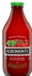
AGROMONTE Salsa di ciliegino al basilico Cherry tomato and basil sauce Cod: 0078677 - 33 cl