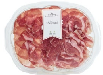
COPPA DI ALTA QUALITÀ High Quality coppa (pork) senza glutine, senza lattosio gluten free, lactose free Cod: 0020483 - 100 g