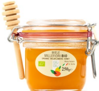
MIELE MILLEFIORI BIO CON SPARGIMIELE Organic wildflowers honey with dripper Cod: 0028608 - 250 g