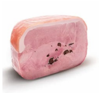
PROSCIUTTO COTTO AL TARTUFO Truffles cooked ham Cod: 0076637