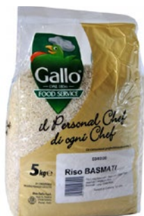
GALLO Riso Basmati Basmati rice Cod: 0027730 - 5 kg