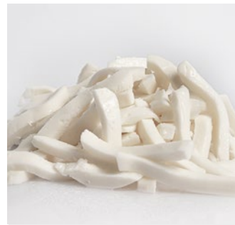
MOZZARELLA JULIENNE Julienne cut mozzarella Cod: 0035044 - 2,5 kg