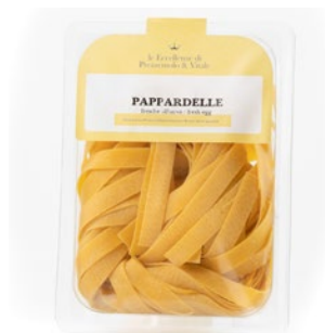
PAPPARDELLE Fresh egg Pappardelle Cod: 0030603 - 250 g