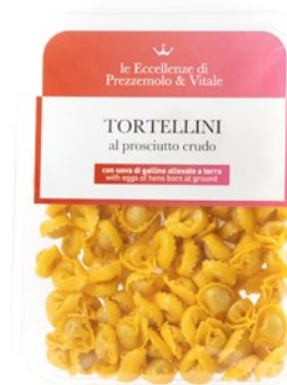
TORTELLINI AL PROSCIUTTO CRUDO Raw ham tortellini Cod: 0029004 - 250 g