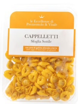
CAPPELLETTI SFOGLIA SOTTILE Thin dough cappelletti Cod: 0025007 - 250 g