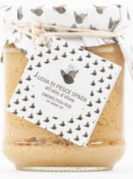
UOVA DI PESCE SPADA ALL'OLIO D'OLIVA Swordfish roe in olive oil Cod: 0030254 - 190 g