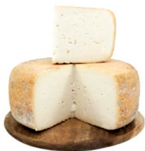
TUMA NERA DEI PIRENEI Pyrenees black tuma Cod: 0026502