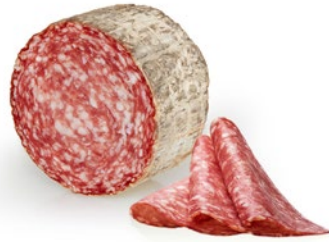
SALAME MILANO "Milano" salami Cod: 0053413