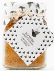
BOTTARGA DI TONNO GRATTUGGIATA Tuna grated bottarga Cod: 0030269 - 42 g