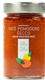
PATÉ DI POMODORO SECCO Dried tomatoes paté Cod: 0078688 - 200 g