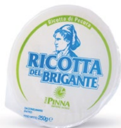
RICOTTA DEL BRIGANTE Leaf wrapped burrata Cod: 0030881 - 250 g