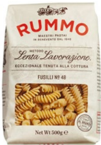
RUMMO Fusilli n° 48 Cod: 0019765 - 500 g Cod: 0035051 - 2 kg