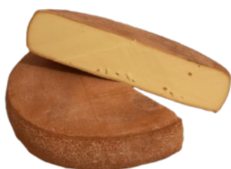
RACLETTE Cod: 0056226