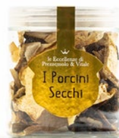
PORCINI SECCHI Dried porcini mushrooms Cod: 0031479 - 20 g