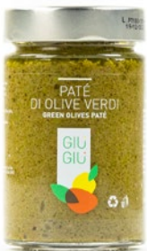
PATÉ DI OLIVE VERDI Green olives paté Cod: 0075057 - 200 g