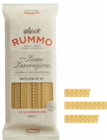
RUMMO - LE LEGGENDARIE Mafaldine n° 80 Cod: 0019771 - 500 g