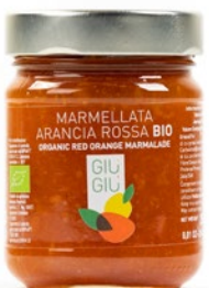
MARMELLATA ARANCIA ROSSA BIO Organic red orange marmelade Cod: 0020384 - 250 g