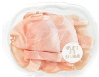
COTTO SAN GIOVANNI San Giovanni cooked ham senza glutine, senza lattosio gluten free, lactose free Cod: 0031448 - 100 g