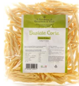
BUSIATE CORTE Handmade durum wheat semolina pasta Cod: 0030332 - 500 g