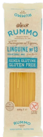
RUMMO Linguine n°13 Cod: 0073398 - 400 g