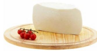
TUMA 100% LATTE DI PECORA 100% sheep's milk tuma cheese Cod: 0054126