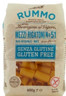
RUMMO Mezzi rigatoni n°51 Cod: 0073401 - 400 g