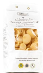
LUMACONI Lenta essiccazione trafilata al bronzo Slow drying / bronze drawn Cod: 0031728 - 500 g