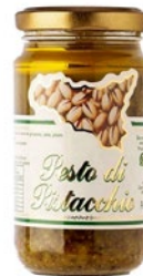
SICILIA PERFETTA Pesto di pistacchio Pistachio pesto Cod: 0020377 - 150 g