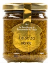
SALSA VERDE Green sauce Cod: 0033527 - 190 g