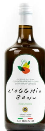
OLIO EXTRA VERGINE DI OLIVA BIANCOLLILLA IGP SICILIA P.G.I. Sicily Biancolilla extra virgin olive oil Cod: 0029933 - 1 L