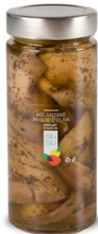
FILETTI DI MELANZANE IN OLIO D'OLIVA Eggplant in olive oil Cod: 0030352 - 314 ml