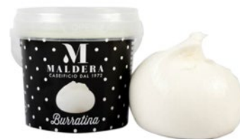
BURRATINA IN BARATTOLO Little burrata in a jar Cod: 0026759 - 100 g