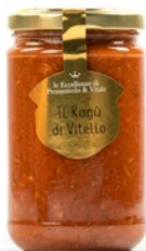
RAGÙ DI VITELLO Veal ragù Cod: 0030520 - 300 g