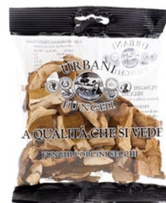
URBANI Funghi porcini secchi Dried Porcini mushrooms Cod: 0057754 - 20 g