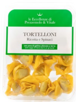
TORTELLONI RICOTTA E SPINACI Ricotta and spinach tortelloni Cod: 0025008 - 250 g