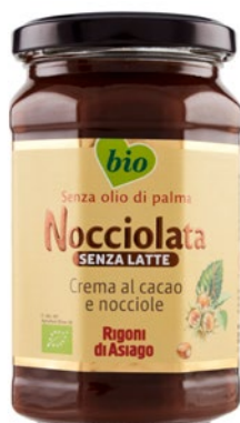
Nociolata BIO Organic hazelnut Nociolata BIO senza latte Organic hazelnut without milk