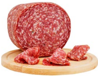
FINOCCHIONA TOSCANA Tuscan finocchiona salami Cod: 0053419