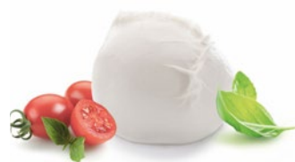
MOZZARELLA DI BUFALA BIO Organic buffalo mozzarella Cod: 0032007 - 500 g