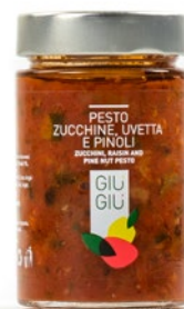
PESTO ZUCCHINE UVETTA E PINOLI Zucchini, raisin and pine nut pesto Cod: 0078532 - 200 g