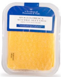
SFOGLIE DI LASAGNA Fresh egg Lasagna Cod: 0031485 - 250 g