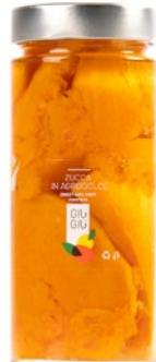
ZUCCA IN AGRODOLCE Sweet-and-sour pumpkin Cod: 0030591 - 314 ml