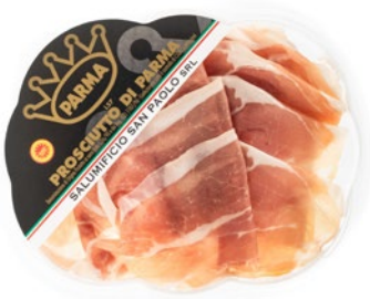
PROSCIUTTO CRUDO DI PARMA Parma raw ham senza glutine, senza lattosio gluten free, lactose free Cod: 0020868 - 100 g