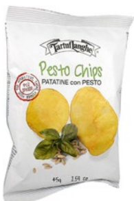
TARTUFLANGHE Patatine al pesto Pesto chips Cod: 0019227 - 45 g