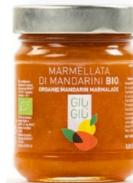
MARMELLATA DI MANDARINI BIO Organic mandarin marmelade Cod: 0020388 - 250 g