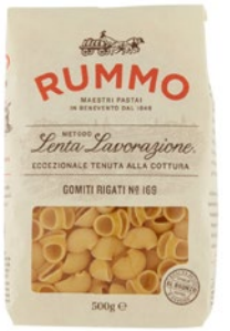
RUMMO Gomiti rigati n° 169 Cod: 0024174 - 500 g