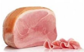
PROSCIUTTO COTTO NEGRONI SIRIO Sirio Negroni cooked ham Cod: 0031484