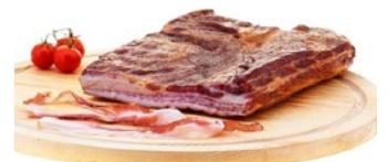
BACON CRUDO Bacon Cod: 0053404