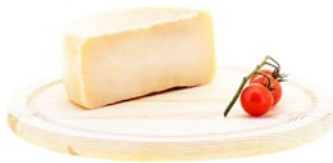
PECORINO TOSCANO FRESCO DOP PDO Tuscan pecorino cheese Cod: 0058158