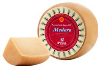
PECORINO SARDO Sardinian pecorino cheese Cod: 0026814