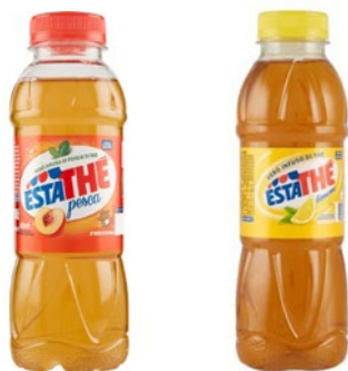
FERRERO Estathè Pesca / Peach Cod: 0030287 - 40 cl Limone / Lemon Cod: 0030825 - 40 cl