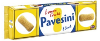
PAVESI Pavesini Cod: 0013087 - 200 g