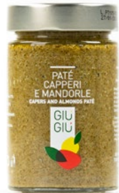
PATÉ DI CAPPERI E MANDORLE Capers and almonds paté Cod: 0064103 - 200 g