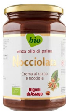
RIGONI Crema spalmabile BIO Organic spreadable cream