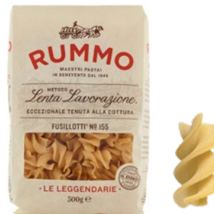
RUMMO - LE LEGGENDARIE Fusillotti n° 155 Cod: 0019776 - 500 g