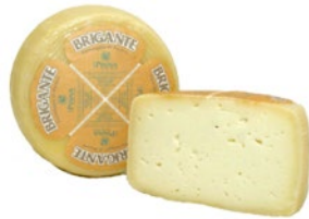
BRIGANTE SARDO CLASSICO Classic Sardinian brigante Cod: 0053376