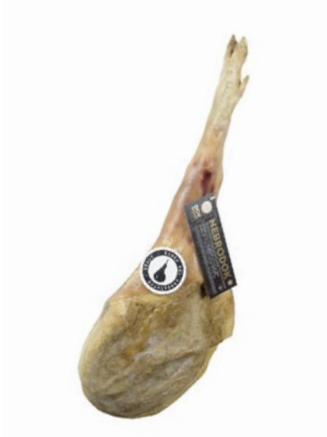
PROSCIUTTO CRUDO NEBRODOK Nebrodok raw ham Cod: 0059449