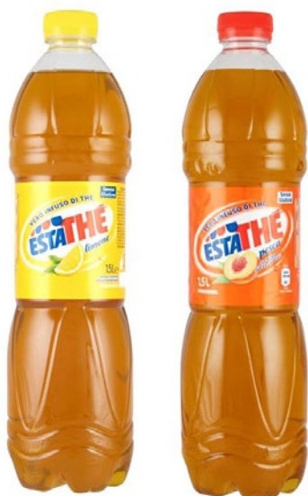
FERRERO Estathè Limone / Lemon Cod: 0016955 - 1,5 L Pesca / Peach Cod: 0016957 - 1,5 L