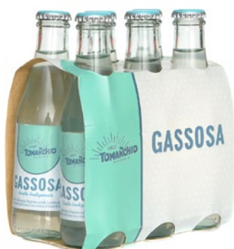
TOMARCHIO Gassosa / Soda Cod: 0016673 - 20 cl x 6