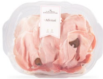
PROSCIUTTO COTTO AL TARTUFO Cooked ham with truffles senza glutine, senza lattosio gluten free, lactose free Cod: 0032249 - 100 g