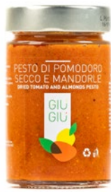
PESTO POMODORO SECCO E MANDORLA Dried tomato and almond pesto Cod: 0078160 - 200 g