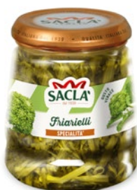
SACLÀ Friarielli in olio di semi di girasole Friarielli in sunflower oil Cod: 0021006 - 280 g