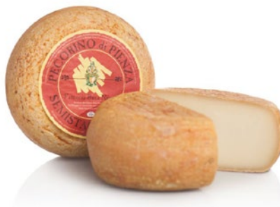
PIENZA ROSSO Red Pienza cheese Cod: 0032288