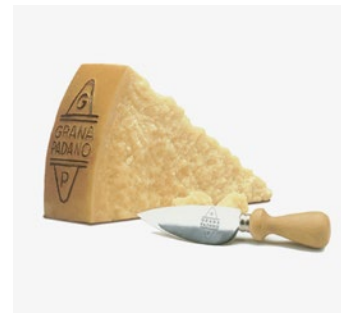
GRANA PADANO 12/13 MESI 12/13 month seasoned cheese 1/8 Cod: 0015521