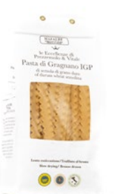
MAFALDE Lenta essiccazione trafilata al bronzo Slow drying / bronze drawn Cod: 0035037 - 500 g