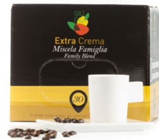
EXTRA CREMA 30 CIALDE 30 Extra creamy coffee pods Cod: 0025310 - 225 g