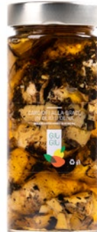
CARCIOFI ALLA BRACE IN OLIO DI OLIVA Grilled artichokes in olive oil Cod: 0030348 - 314 ml Cod: 0030596 - 2,8 kg