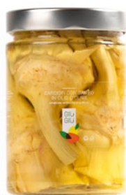
CARCIOFI CON GAMBO IN OLIO D'OLIVA Artichokes with stem in olive oil Cod: 0030349 - 580 ml