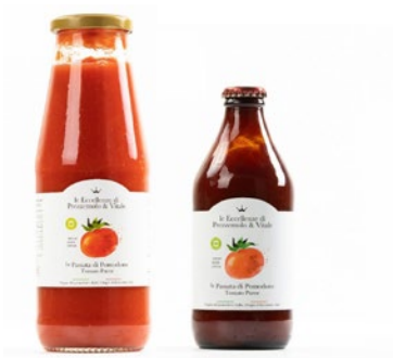
PASSATA DI POMODORO Tomato purée Senza acido citrico Citric acid-free Cod: 0029376 - 660 g Cod: 0029379 - 330 g