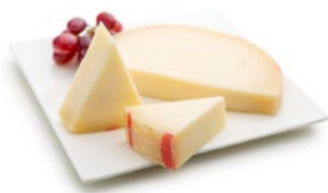
PROVOLONE PICCANTE Piquant provolone Cod: 0027792 - 250 g