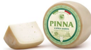
CAPRA SARDA Sardinian goat cheese Cod: 0026817