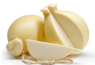
PROVOLA DEL CASALE Provola cheese 1/2 Forma/ 1/2 wheel Cod: 0027464