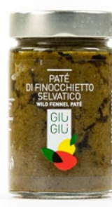
PATÉ DI FINOCCHIETTO SELVATICO Wild fennel paté Cod: 0078161 - 200 g