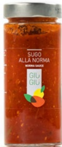
SUGO ALLA NORMA Norma sauce Cod: 0066084 - 300g