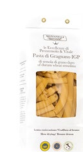
MEZZANELLI Lenta essiccazione trafilata al bronzo Slow drying / bronze drawn Cod: 0031639 - 500 g