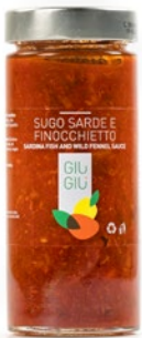
SUGO SARDE E FINOCCHIETTO Sardina fish and wild fennel sauce Cod: 0066153 - 300 g