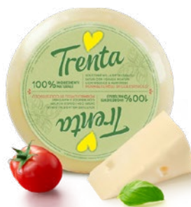
TRENTA SENZA COLESTEROLO cholesterol-free slices Cod: 0025939