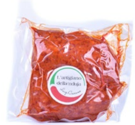
NDUJA A FETTE - sotto vuoto Nduja slices - vacuum Cod: 0035157 - 300 g