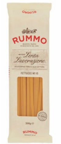
RUMMO Fettucce n° 15 Cod: 0019762 - 500 g