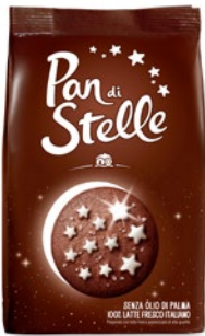
MULINO BIANCO Pan di stelle Cod: 0031911 - 350 g