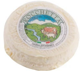
ALTA LANGA ROCCHETTA Cod: 0066713 - 230 g ca