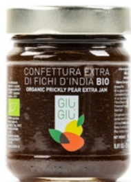
CONFETTURA EXTRA DI FICHI D'INDIA BIO Organic prickly pear extra jam Cod: 0020379 - 250 g