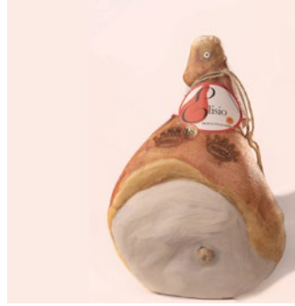
PROSCIUTTO CRUDO DI PARMA (DISOSSATO) Parma raw ham (boneless) Cod: 0031512