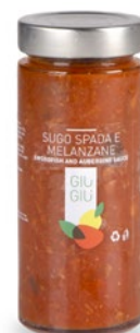
SUGO PESCE SPADA E MELANZANE Tomato sauce with swordfish and aubergines Cod: 0066152 - 300 g