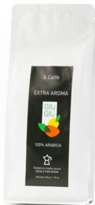
CAFFÈ EXTRA AROMA Extra aroma coffee Cod: 0023268 - 200 g