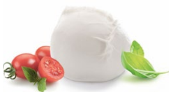
MOZZARELLA DI BUFALA DOP PDO buffalo mozzarella Cod: 0033586 - 250 g Cod: 0023081 - 3 kg